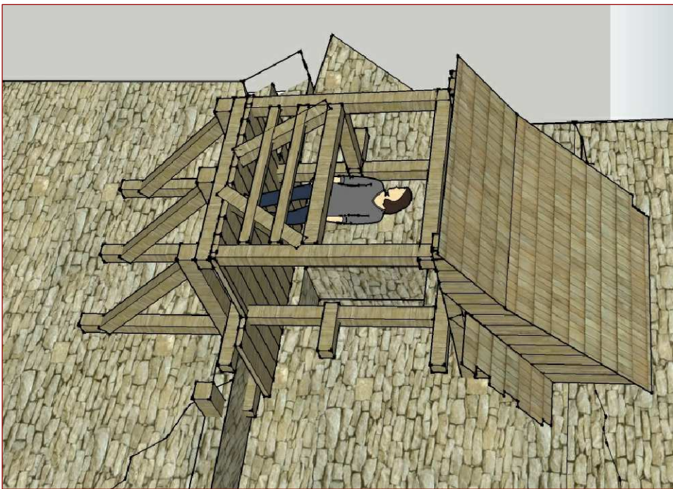
PRIESTOROVÉ ZOBRAZENIE OCHODZE